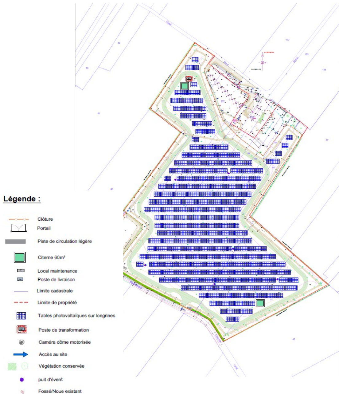
Plan masse du projet – extrait étude d'impact page 29

L'arrêt de l'activité a fait l'objet d'un arrêté préfectoral en date du 20 février 2004 prescrivant des mesures pour la fermeture et la réhabilitation du site, dont le réaménagement a été achevé en 2005.